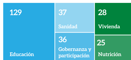
Gráfico 2- Número de medidas analizadas por temática

Según las respuestas del cuestionario, en España 2 de cada 3 entidades locales conocen la Garantía Infantil Europea . La mayoría de estas consideran que otorgan 'bastante' (46%) importancia a la lucha contra la pobreza infantil, seguida por 'mucho' (38%), 'media' (13,5%) y, finalmente, 'poca' (2,5%). No hay ninguna entidad que le otorgue 'muy poca' importancia.